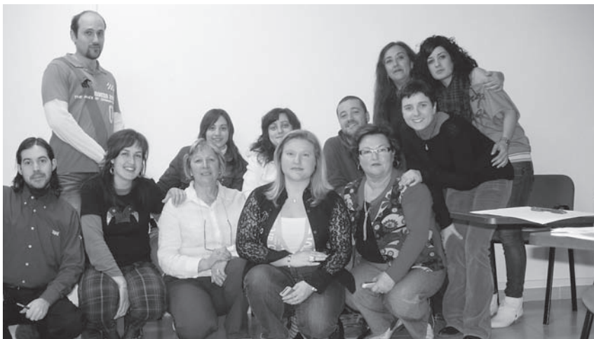
Participantes en el curso Control del Estrés y de la Ansiedad.

También se ha desarrollado otra acción formativa, el curso Control del Estrés y de la Ansiedad para profesionales ocupados. Curso iniciado el 18 de febrero y terminado el 18 de marzo. Los tres cursos han sido de modalidad presencial.